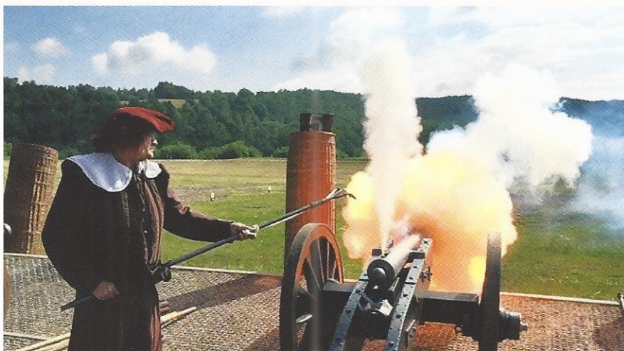
Imposanter Anblick von der Europameisterschaft der Kanoniere.

Der VDSK, Verband Deutscher Schwarzpulver Kanoniere, mit seinem Sitz auf Burg Allstedt veranstaltete im Juni bereits die dritte Europameisterschaft der leichten Feldartillerie. Auf dem Truppenübungsplatz der Bundeswehr in Sondershausen traten mehr als 130 Mannschaften zum fairen Wettstreit mit ihren Vorderladerkanonen an. In historischen Uniformen gaben alle Kanonierinnen und Kanoniere ihr Bestes und ermittelten die Sieger. Die Teilnehmer lagerten im historischen Biwak gleich nebenan. Ein buntes Rahmenprogramm verlieh der Veranstaltung eine besondere Note.