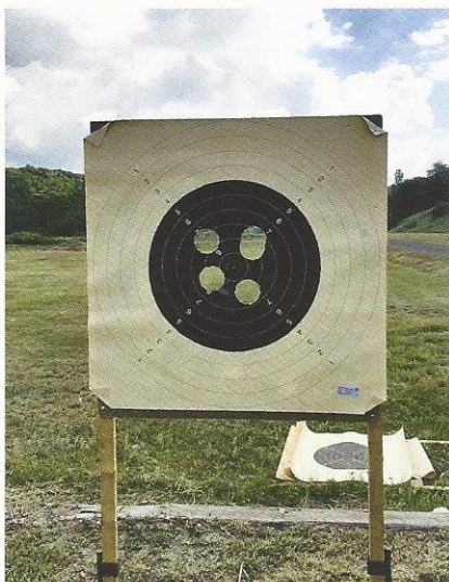
Nicht ganz zentral, aber dennoch ein beachtliches Trefferbild.