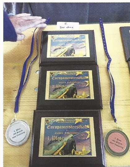
Belohnung für die Besten: Medaillen und Erinnerungstafeln.