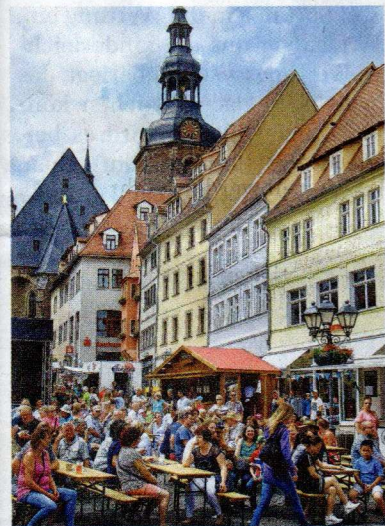
Die Plätze vor der Bühne waren schnell besetzt.