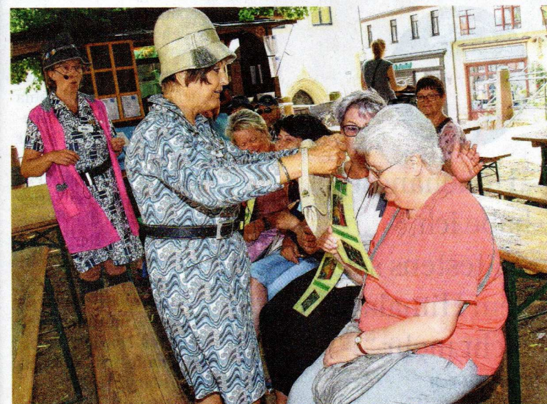
Die Komödiantinnen Hilde (li.) und Trude in ihrem Element.