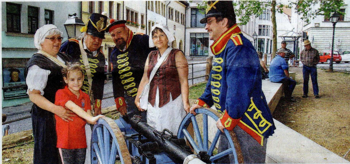
Die Gruppe „Royal Foot Artillery“ aus Eisleben stellte eine britische Kanonenbesatzung dar.