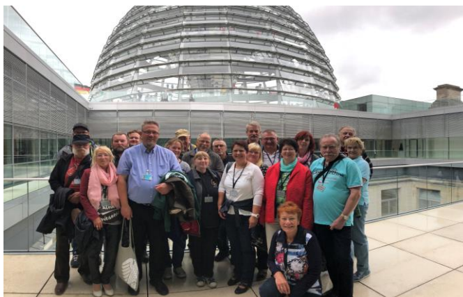
Besuch Reichstag 2018

Beste Versorgung, Unterhaltung, Musik, Feuerwerk, WC und reichlich Platz für ein gepflegtes Zeltlager (Kanonen-Biwak-Triptis lässt grüßen!).